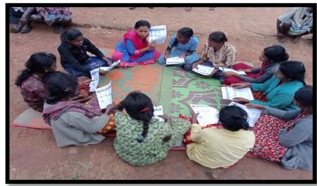
Community awareness program