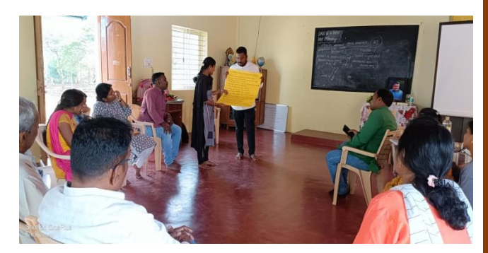
Staff training on Gram Swaraj and Panchayath Raj Act 1993