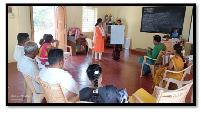
Grama Swaraj and Panchayath Raj training