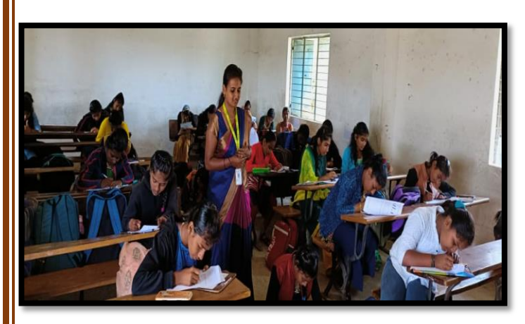
2<sup>nd</sup> cycle Orientation at North Karnataka (Gadag) region