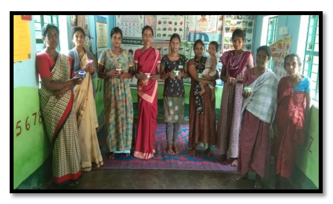
KYC of beneficiary and capsule distribution