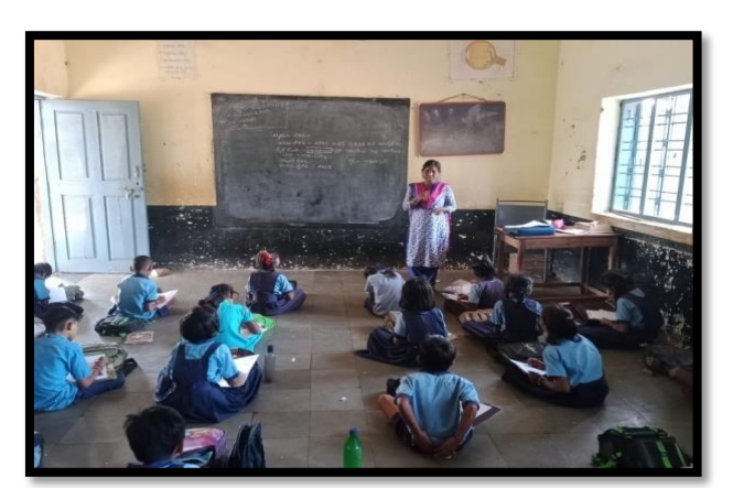
Assessment in schools