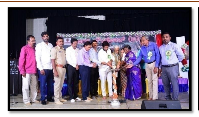
{\it Inauguration from MLA~of~H~D~Kote}