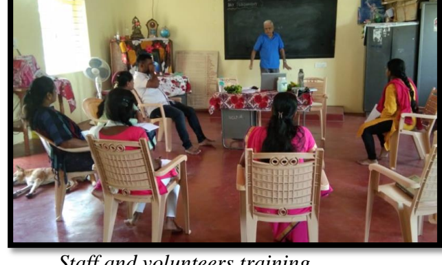
Staff and volunteers training