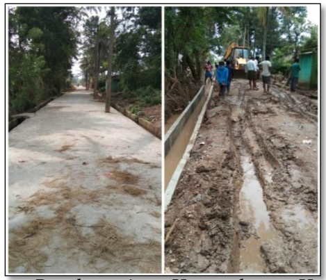
Road repair at Hunasekuppe Hadi