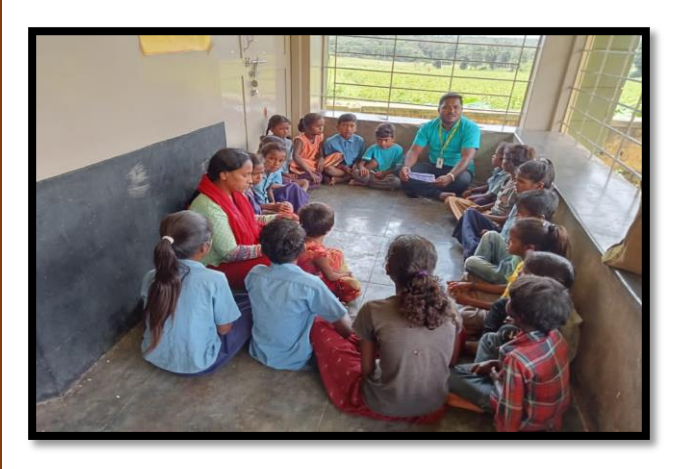
Children group awareness program

Awareness programs: During the year 2022-23 an awareness on Childline-1098 were given to 20 SHGs, 109 schools, 27 Grama Panchayaths visit, 8 PHC's, 7 shops, and in 10 markets. 175 Asha workers, 14 police station consisting of 130 police staff. 138 Anganawadi workers took active participation in avoiding child marriages in and around the operational area of Childline, 56 tribal awareness consisting of 1895 people. 8 community awareness consisting of 340 people. 49 mothers meeting, 22 youth groups and 45 Children group were formed during the year 2022-23.