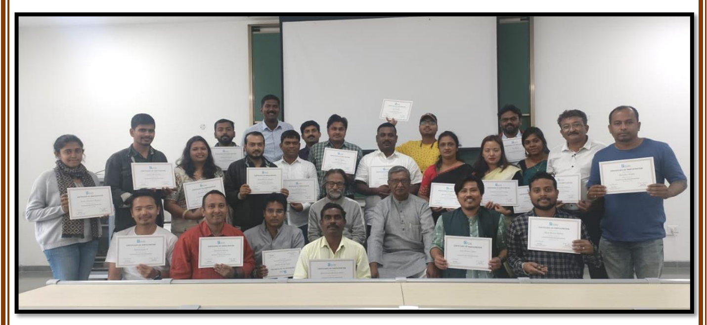
Local Democracy certificate training at Bangalore conducted by Azim Premji University