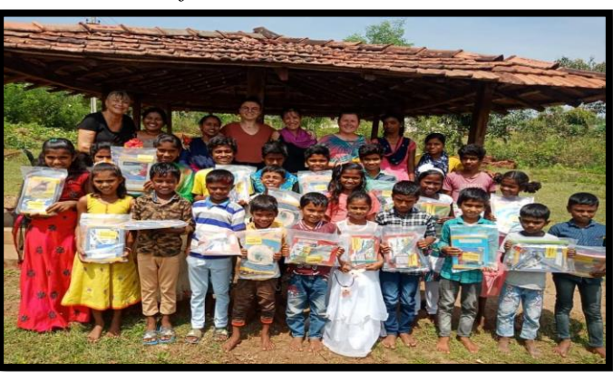
Masthigudi A Hadi School