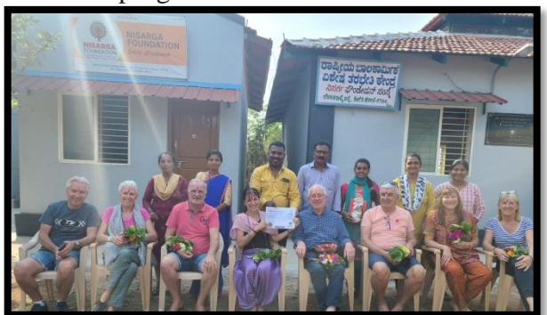
Mission Inde, France team visit