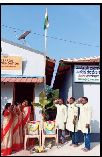
Independence day, Republic day, Ayuda Pooja festival, Yugadi, New Year 2023, International women's day was celebrated at NF office.