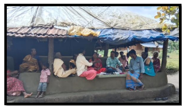
Bavali Hadi Gramasabha