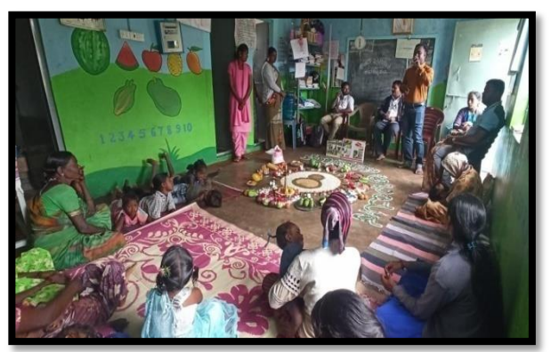
Community awareness at Sonalli Hadi