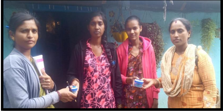
Spirulina capsule distribution

At the start of 16th batch of Spirulina: Beneficiaries: 60 / Pregnant women: 8 / Lactating Mothers: 30 and 22 children. Out of the 22 children 1 child is having deficit of 5.2kgs, 16 Children were having deficit of more than 2 Kgs.