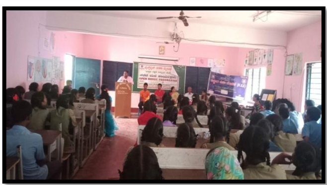
Open house programs in different schools

Awareness programs: During the year 2022-23 an awareness on Childline-1098 were given to 20 SHGs, 109 schools, 27 Grama Panchayaths visit, 8 PHC's, 7 shops, and in 10 markets. 175 Asha workers, 14 police station consisting of 130 police staff. 138 Anganawadi workers took active participation in avoiding child marriages in and around the operational area of Childline, 56 tribal awareness consisting of 1895 people. 8 community awareness consisting of 340 people. 49 mothers meeting, 22 youth groups and 45 Children group were formed during the year 2022-23.