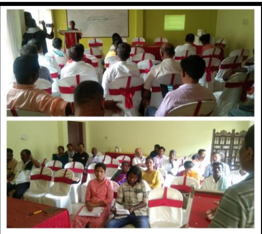
Vision building training at Chennai